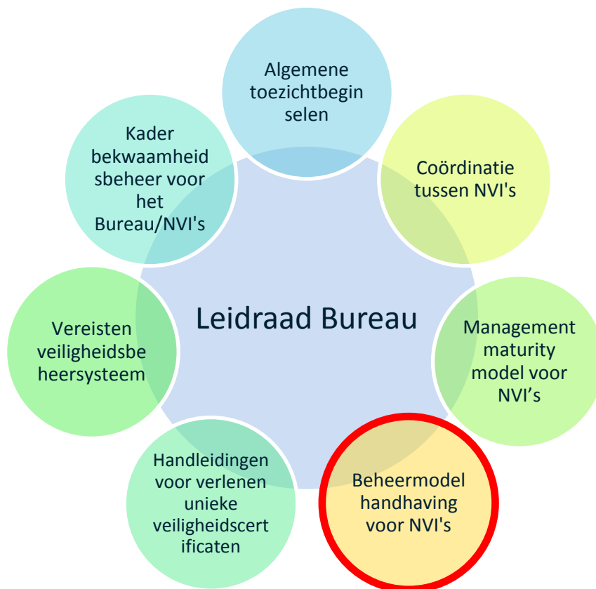
Afbeelding 1: Compendium van richtsnoeren van het Bureau

Error! Reference source not found. Error! Reference source not found.0