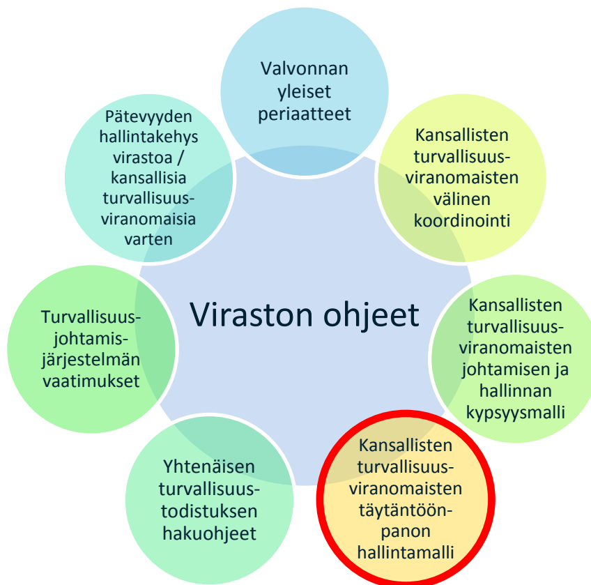
Kaavio 1. Yhteenveto viraston ohjeista.

Tämä asiakirja on osa viraston ohjeita, joilla tuetaan rautatieyrityksiä, rataverkon haltijoita, kansallisia turvallisuusviranomaisia sekä virastoa, kun ne täyttävät velvoitteitaan ja toteuttavat tehtäviään direktiivin (EU) 2016/798 mukaisesti.